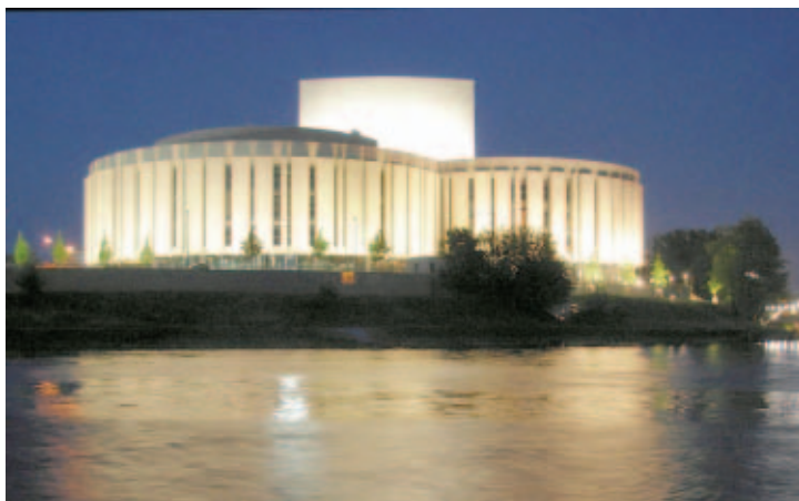
Театр «Опера Нова», который станет центром фестиваля